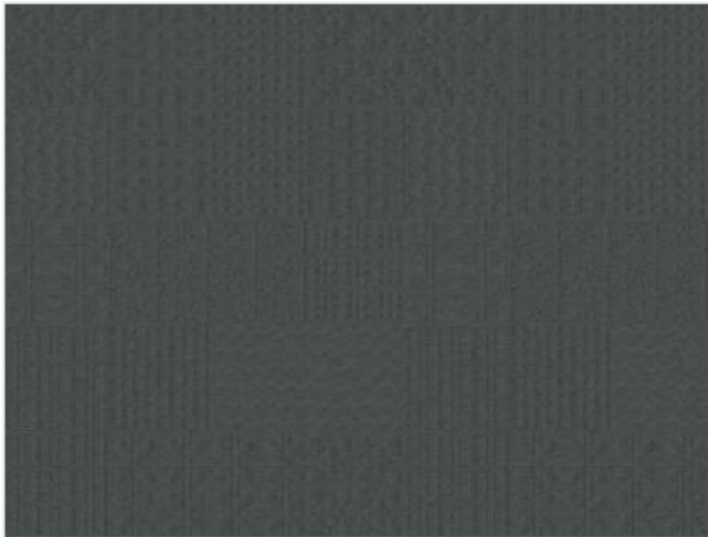
Full width simulation (≈125 cm)