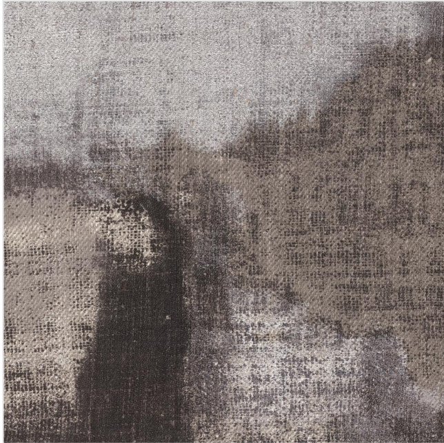
Product scan (=~20x20 cm) or picture