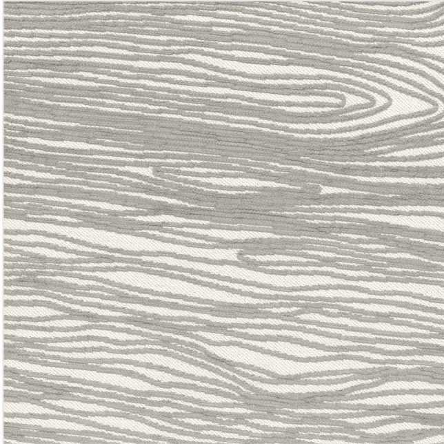
Product scan (≈20x20 cm) or picture