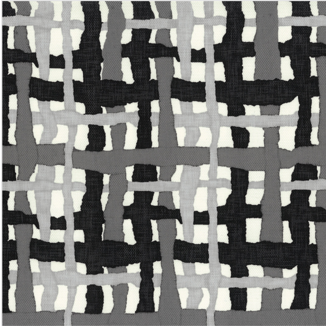
Product scan (≈20x20 cm) or picture