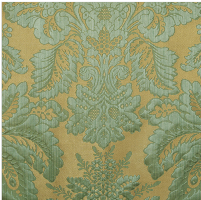
Product scan (≈20x20 cm) or picture