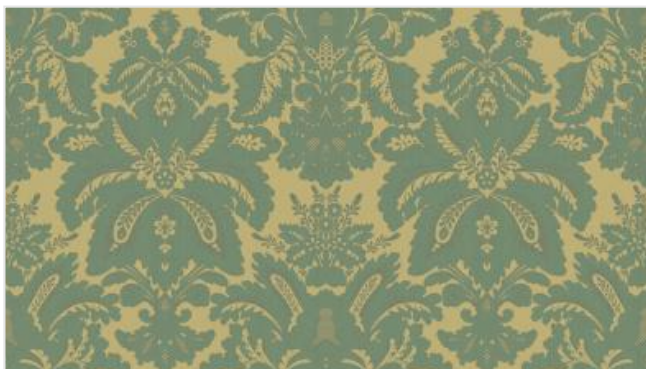
Full width simulation (≈140 cm)