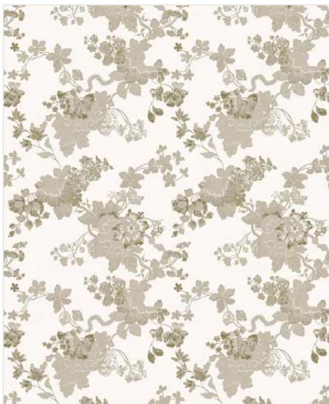
Full width simulation (≈70 cm)