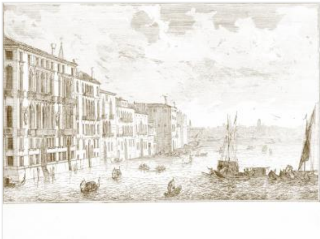
Full width simulation (≈100 cm)