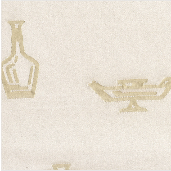
Product scan (≈20x20 cm) or picture