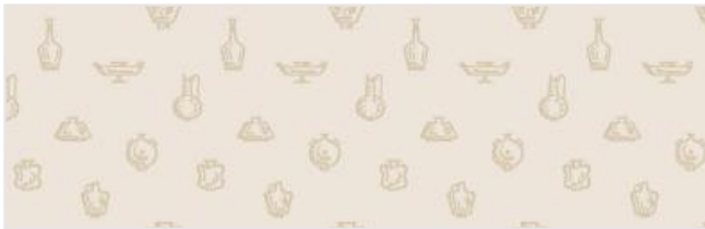
Full width simulation (≈140 cm)