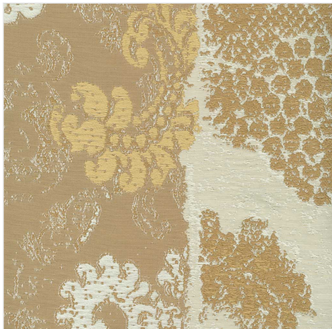
Product scan (≈20x20 cm) or picture