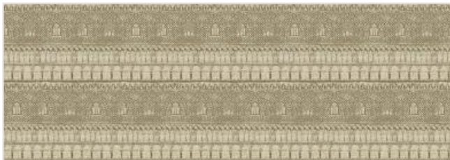
Full width simulation (≈120 cm)