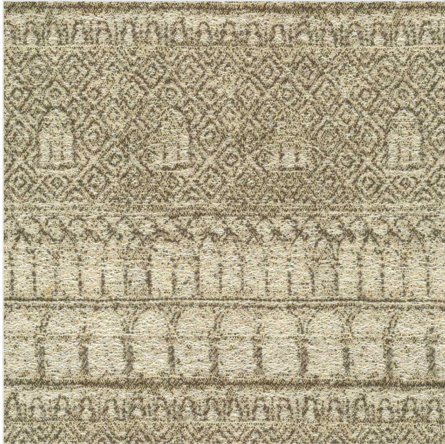
Product scan (≈20x20 cm) or picture