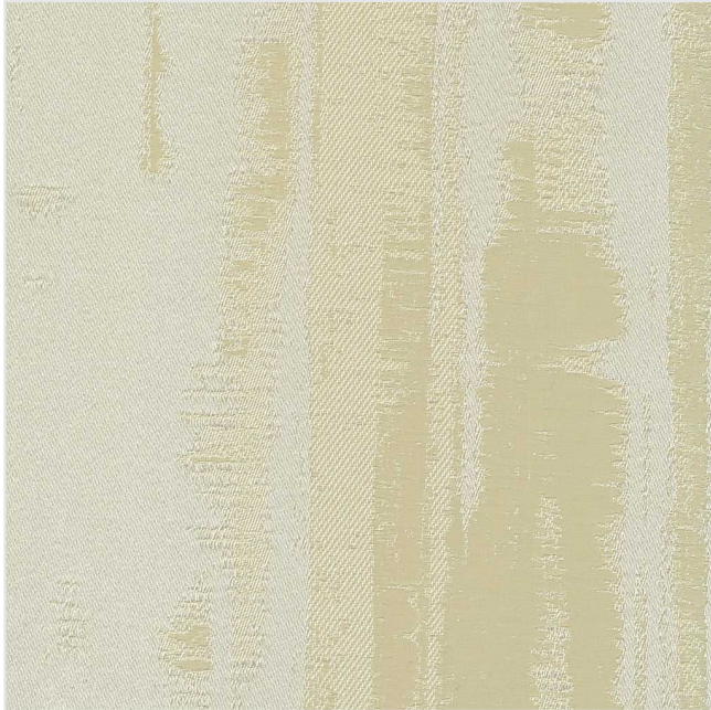
Product scan (≈20x20 cm) or picture