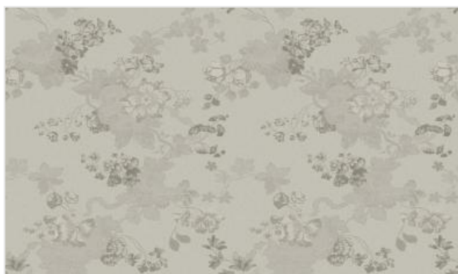
Full width simulation (≈140 cm)