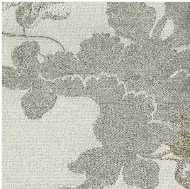
Product scan (≈20x20 cm) or picture