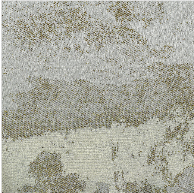
Product scan (≈20x20 cm) or picture