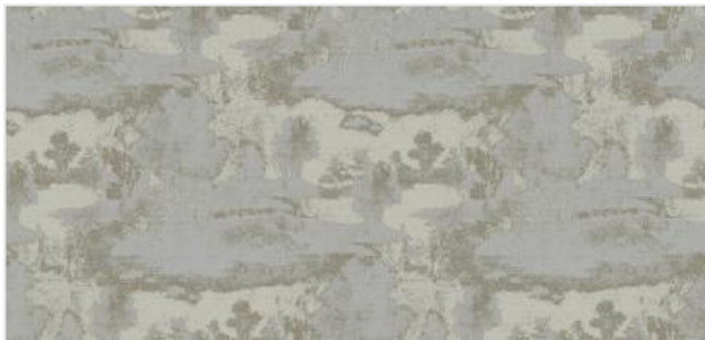
Full width simulation (≈135 cm)