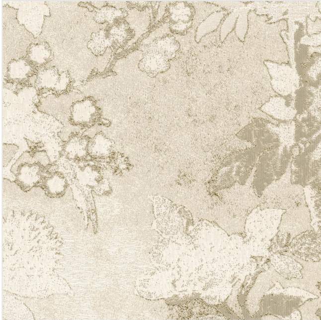
Product scan (≈20x20 cm) or picture