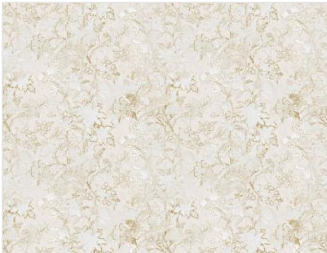
Full width simulation (≈135 cm)