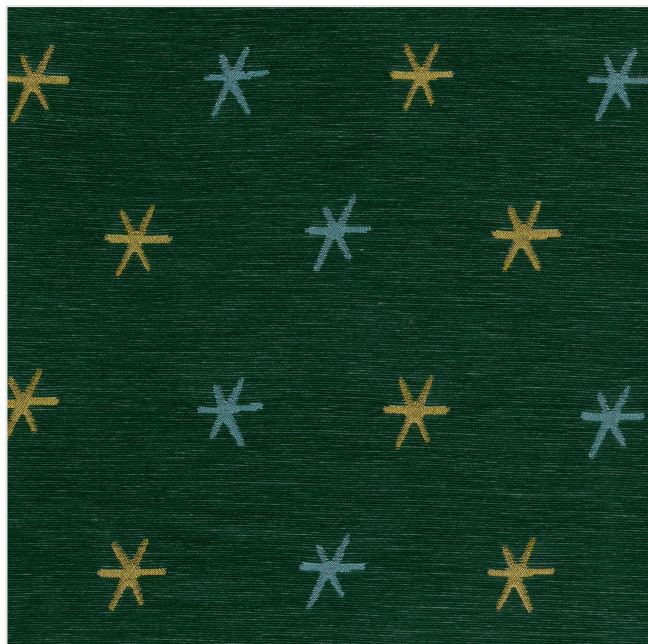
Product scan (≈20x20 cm) or picture