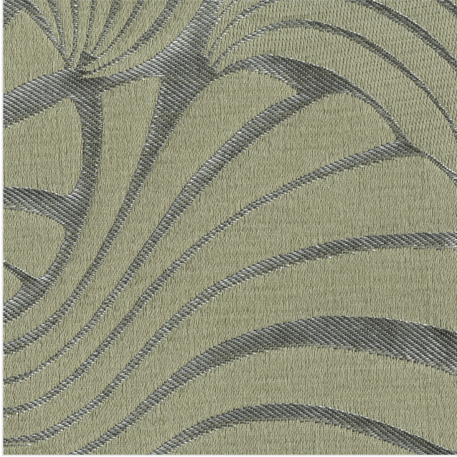
Product scan (≈20x20 cm) or picture