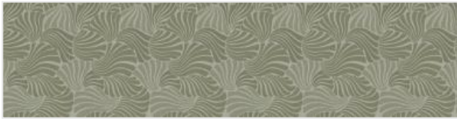
Full width simulation (≈140 cm)