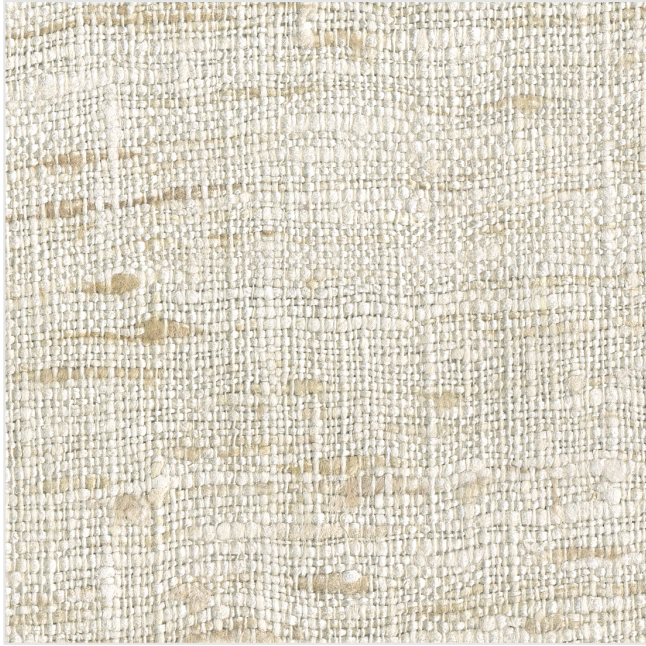
Product scan (=~20x20 cm) or picture