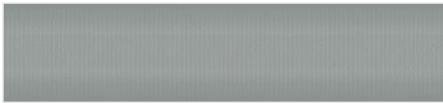
Full width simulation (≈140 cm)