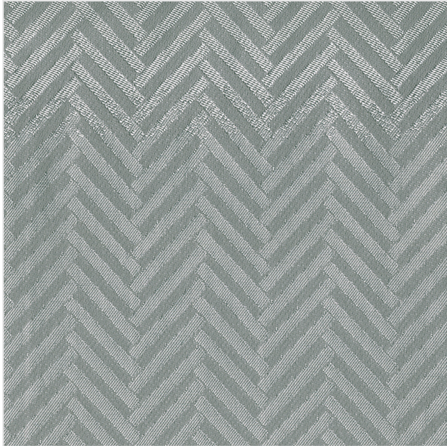
Product scan (≈20x20 cm) or picture